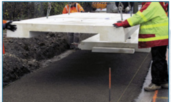
4. Installation des modules