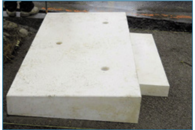
2. Positionnement de la rampe d'accès