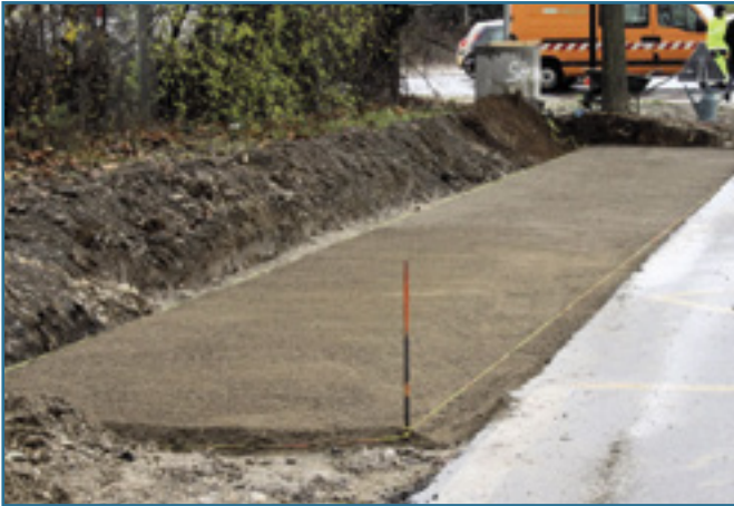
1. Terrassement - préparation