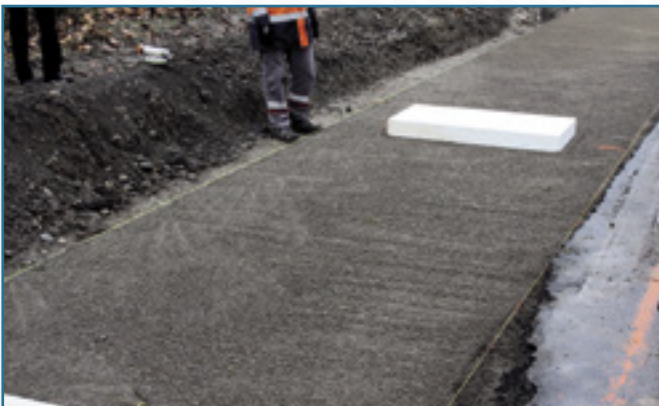
3. Positionnement clé de blocage